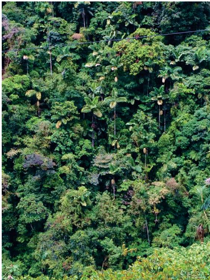
Fotografía del piedemonte Amazónico.

El pago del incentivo a la conservación se debe calcular mediante la comparación entre el costo de oportunidad del uso del suelo y el benefi-