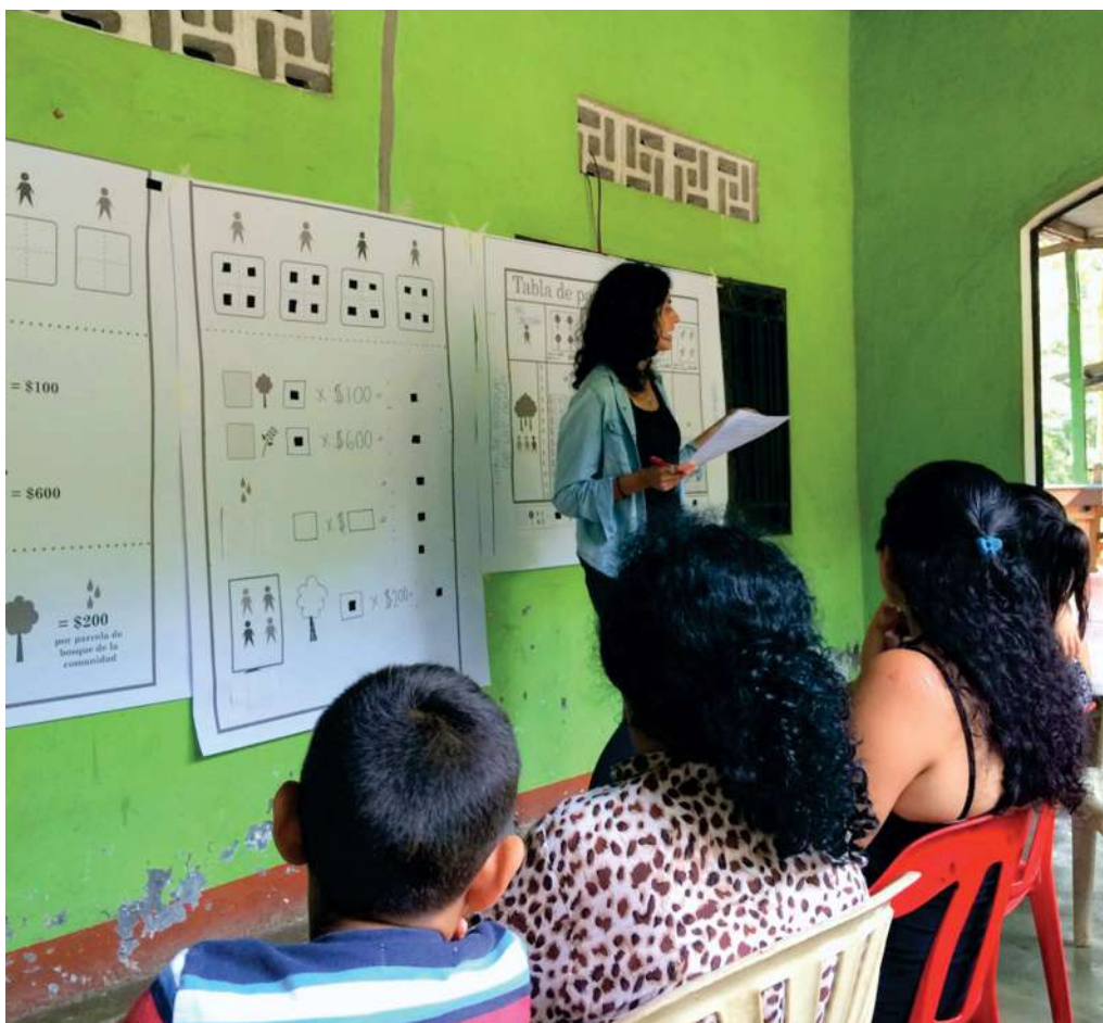
Investigadora explicando la metodología del experimento.